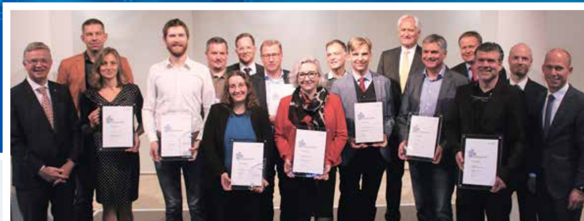
Heinz Eininger, Landrat des Landkreises Esslingen